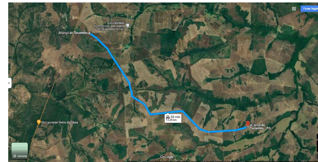
5 PLANTA DE LOCALIZAÇÃO SEM ESCALA