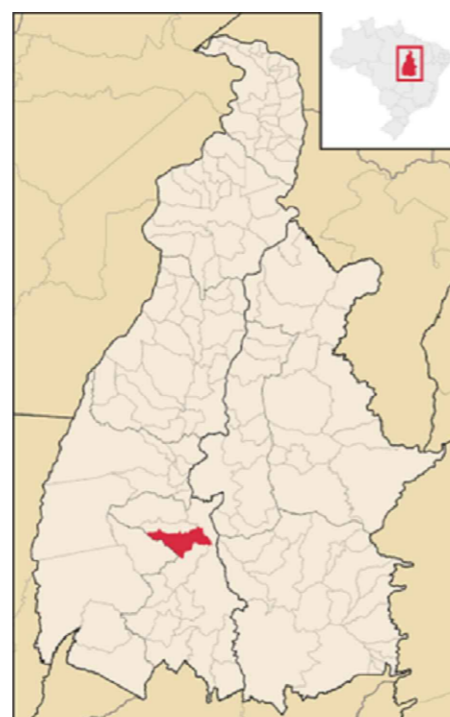
2 LOCALIZAÇÃO DE ALIANÇA DO TOCANTINS NO TOCANTINS SEM ESCALA