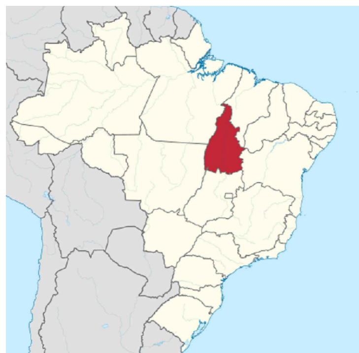
1 LOCALIZAÇÃO DO ESTADO DO TOCANTINS NO BRASIL SEM ESCALA